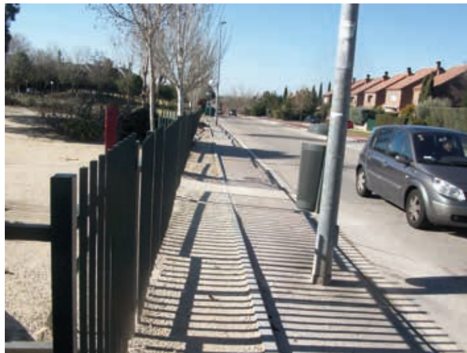
Avda. de Esparta, antes

Por último, se han eliminado malas hierbas a lo largo de todo el municipio, con especial atención en el desbroce de alcorques de los árboles del viario público en los barrios de La Marazuela, El Montecillo, Los Castillos, Parque Empresarial, El Cantizal, Punta Galea y Sector IX.