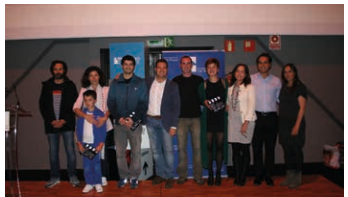
Foto de familia con los ganadores del certamen