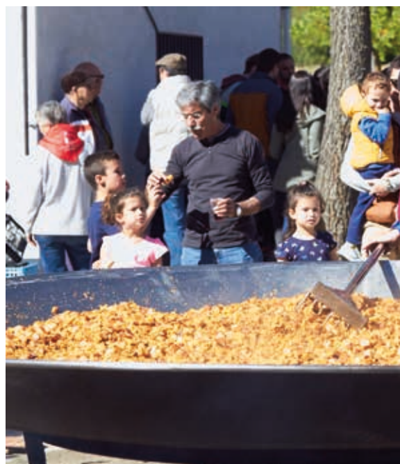
Las peñas ofrecieron almuerzos populares