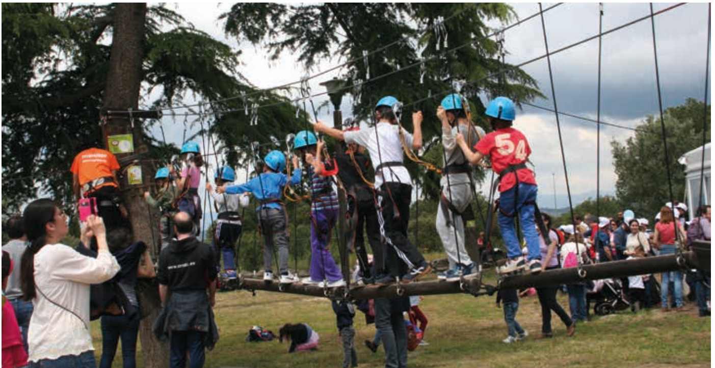
Una de las actividades organizadas para disfrutar en familia

La Finca de El Pilar fue el escenario de este encuentro de convivencia en el que las familias del municipio compartieron un tiempo de ocio, que en esta edición llevó como lema “La familia, una vida sana y un futuro sostenible”, en un día que se conmemora cada 15 de mayo a iniciativa de Naciones Unidas. Además de las diferentes propuestas al aire libre, todas ellas de carácter gratuito, hubo un “food truck” para completar la jornada reponiendo fuerzas.