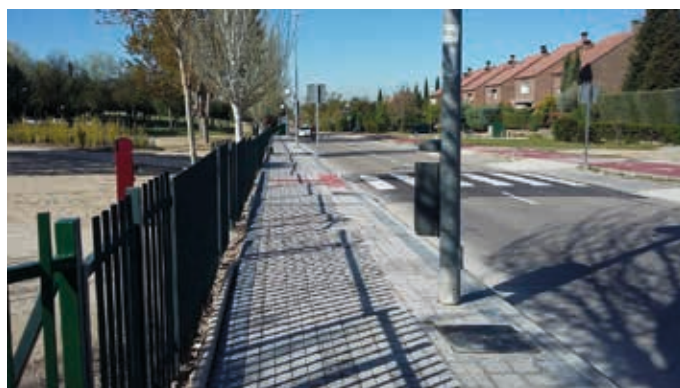
Avda. de Esparta, después