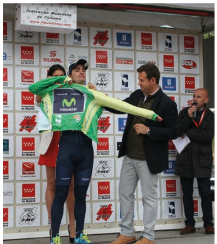
La primera etapa de la Vuelta Ciclista a la Comunidad de Madrid tuvo su salida y meta en Las Rozas