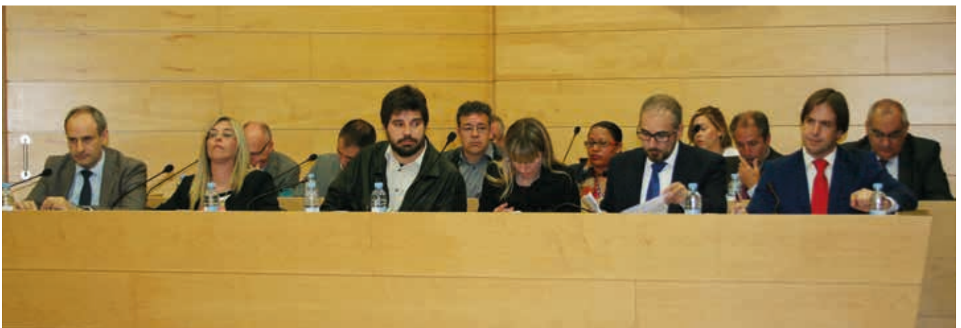
Los portavoces de los distintos grupos políticos en su nueva ubicación en el salón de plenos