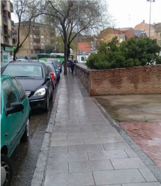
Avda. Iglesia, antes