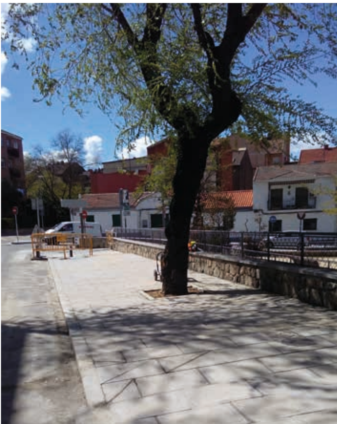
Avda. Iglesia, después