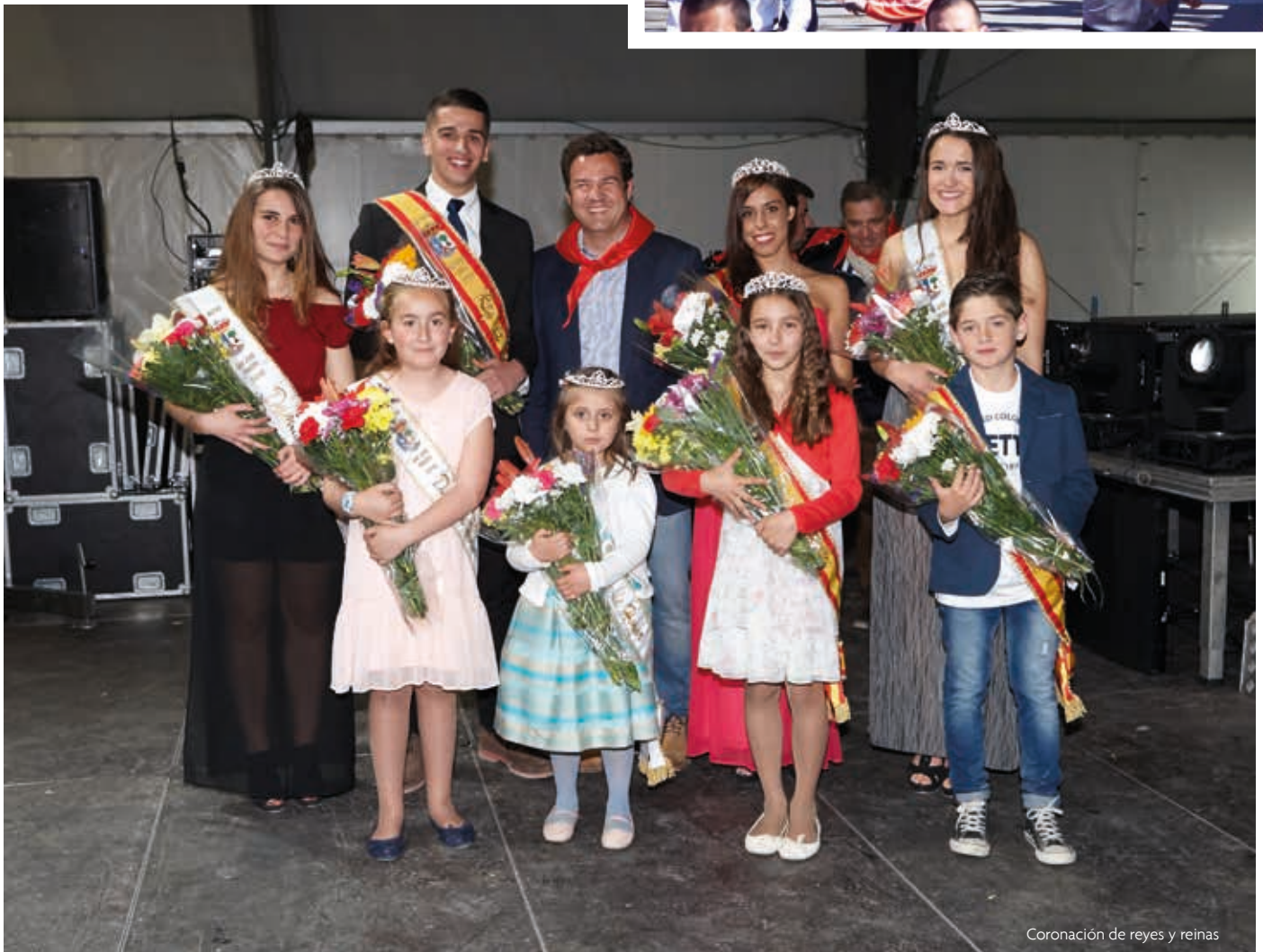
Coronación de reyes y reinas