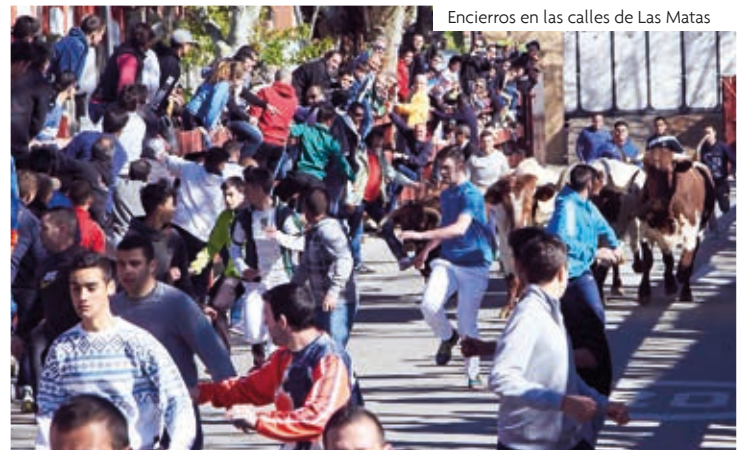
Encierros en las calles de Las Matas

Hubo también momentos dedicados a los más pequeños, que pudieron disfrutar de un parque infantil y un espectáculo, la actuación de varias orquestas, humoristas y algunas citas ya tradicionales en estas fiestas, como los bailes de Vermut y la gran paella popular, ofrecidos por las peñas del barrio