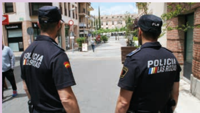
En la imagen, los nuevos uniformes

Cada agente gestionará su limpieza y sus pedidos por medio de un sistema de puntos canjeables según sus propias necesidades a lo largo del año. El contrato actual tendrá una duración de 4 años y no ha supuesto aumento alguno en el presupuesto.