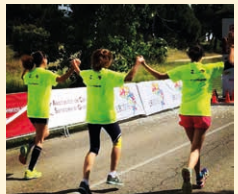
Primera edición de la carrera “Correr sin Glu10”

Por otro lado, el municipio de las Rozas ha participado en la organización de las primeras Jornadas de Divulgación de esta enfermedad con talleres y conferencias. Y se está trabajando en programas de formación de personal de los centros sanitarios para lograr el diagnóstico temprano de la patología, así como el personal de hostelería de la ciudad, con el fin de fomentar que en sus establecimientos se ofrezcan opciones que faciliten la vida de las familias con esta problemática.