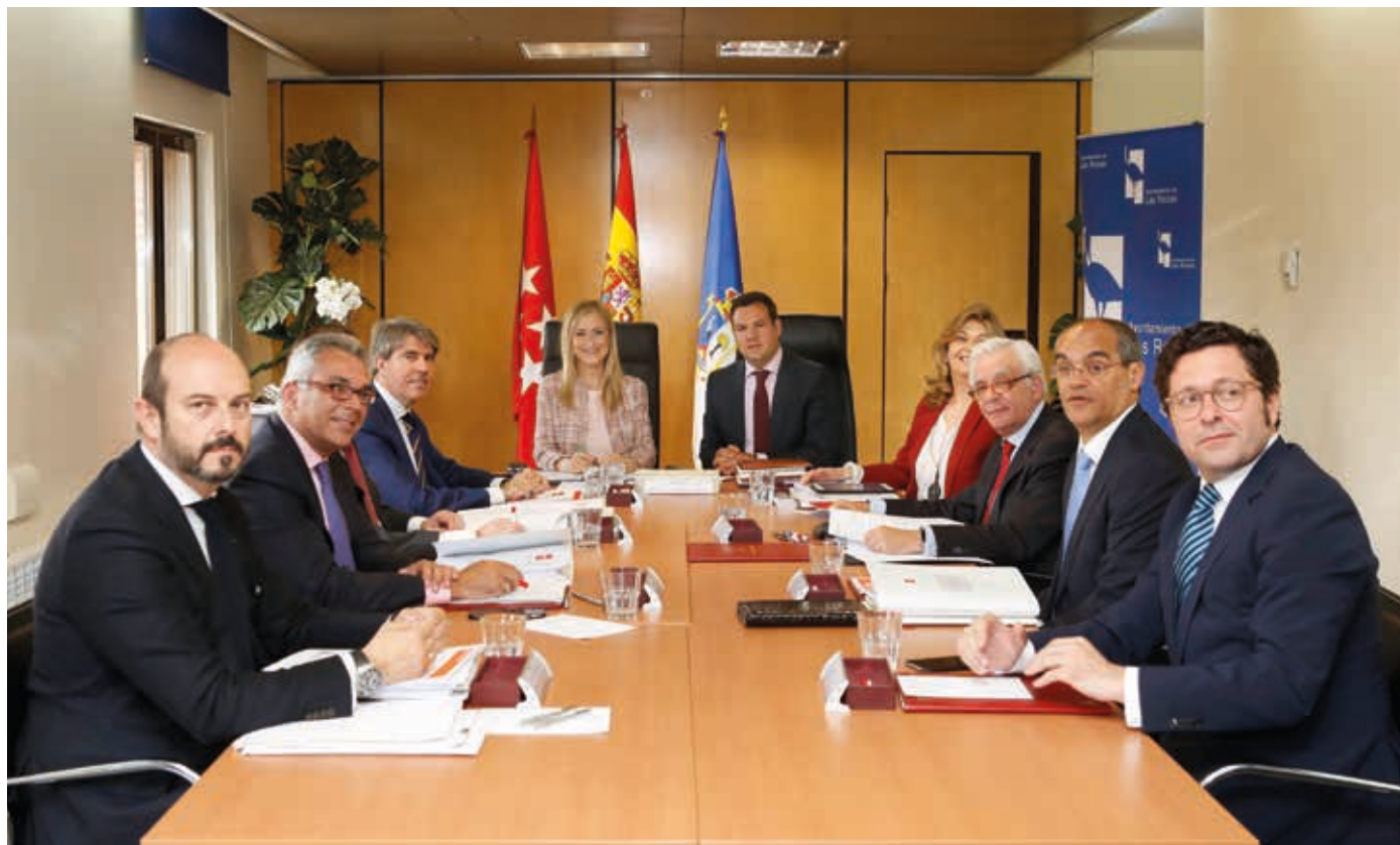
El Consejo de Gobierno de la Comunidad de Madrid celebrado en Las Rozas

La presidenta regional, Cristina Cifuentes, anunció una inversión en el municipio de 327 millones de euros a lo largo de la legislatura